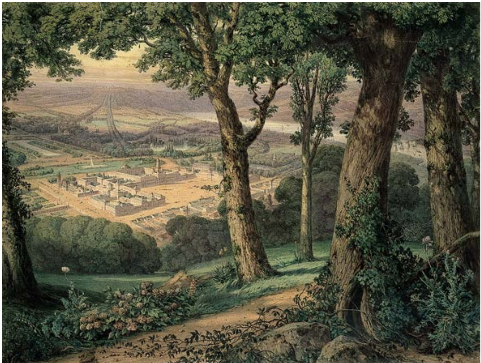
Laurent Pelletier, « Phalanstère rêvé », 1868.

Journées d'étude - Jeudi 13 et vendredi 14 mars 2025